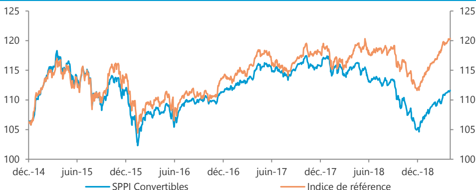
Le graphique ci-dessus représente l'évolution de la valeur liquidative du fonds depuis la transformation en fonds de fonds le 29 décembre 2014.